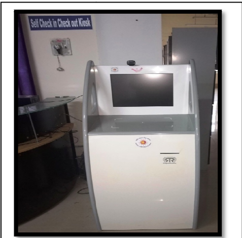
ଉତ୍ତର ଓଡ଼ିଶା ବିଶ୍ୱବିଦ୍ୟାଳୟରେ କାର୍ଯ୍ୟକ୍ଷମ ନଥିବା ଆର୍ ଏଫ୍ ଆଇଟି ବ୍ୟବସ୍ଥା

ଏବଂ ପରୀକ୍ଷାଗାର ସୁବିଧା ରହିଛି । ଏହି ବିଶ୍ୱବିଦ୍ୟାଳୟଗୁଡ଼ିକରେ ଉପଯୁକ୍ତ ଗ୍ରନ୍ଥାଗାର 12 ସୁବିଧା ଅଭାବଥିଲା ଏବଂ ଗ୍ରନ୍ଥାଗାରଗୁଡ଼ିକ କମ୍ପ୍ୟୁଟରୀକରଣ ହୋଇନଥିଲା । ଉପଭୋକ୍ତା ଚିହ୍ନଟ, ଚୋରି ସୁରକ୍ଷା ଏବଂ ପୁସ୍ତକ କାରବାରର ସମ୍ପର୍କିତ ପାଇଁ ଉତ୍କଳ ବିଶ୍ୱବିଦ୍ୟାଳୟରେ କୌଣସି ରେଡିଓ ଫ୍ରିକ୍ୱେନ୍ସି ଆଇଡେଣ୍ଟିଫିକେସନ୍